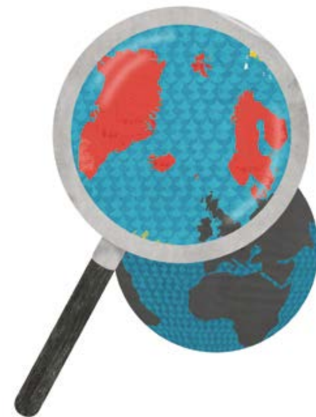
ILLUSTRATION: EMMA HANQUIST

Hon menar att de nordiska föräldraförsäkringssystemen utgår från en tvåföräldersnorm, vilket kan göra det besvärligare för familjer med färre eller fler föräldrar. I Finland har exempelvis bara pappor som bor ihop med barnet rätt till föräldraledighet. Systemet är alltså inte anpassat för separerade föräldrar. I Norge utgår föräldrapenningen från modern. Hon måste ha arbetat innan förlossningen, annars står hon utanför systemet och kan bara kvalificera sig till ett engångsstöd vid barnets födelse. Det drabbar även pappans rätt till ersättning. I Sverige bygger systemet i sin tur på att föräldrarna samarbetar, vilket kan bli problematiskt om de inte kommer överens. Båda parter har rätt till halva föräldraförsäkringen. Om exempelvis pappan, i en heterosexuell relation, inte vill utnyttja sina dagar kan han skriva över